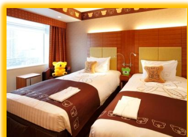
コアラのマーチルーム① マーチくん部屋(全2室)

ロッテ大人気のお菓子「コアラのマーチ」のキャラクターとコラボレーションしたファミリーに大人気のお部屋です。(全4室)