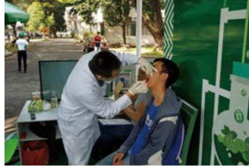
ベトナムでの無料歯科検診

また、日本とベトナムの交流を支援する活動にも協賛しています。2018年度は12月に開催された日越国交樹立45周年記念のサッカーユースカップに協賛しました。