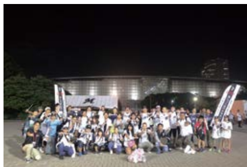
LTO参加者と記念撮影

ゴミを減らすべく街のゴミ拾い活動を行い、海や自然環境への意識を高め、次世代に美しい自然を残すためのプロジェクトです。2018年度は、試合後にファンの皆様とZOZOマリンスタジアム周辺のゴミ拾い活動を16回行いました。