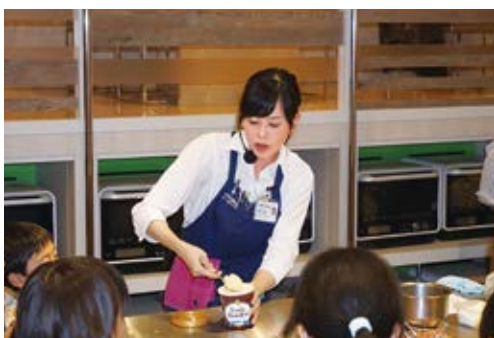
手作り体験教室の様子