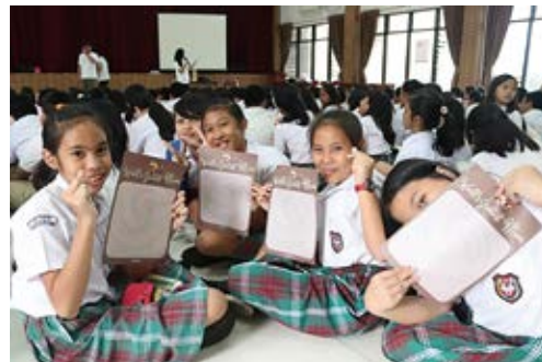
ジャカルタ近郊の小学校にて

また、2018年7月にインドネシアのロンボク島で大きな地震が発生した際には、被災地に「チョコパイ」をお届けしました。