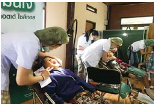
タイでの無料歯科検診

タイロッテでは歯の健康をサポートする活動を行っています。歯の健康に関する知識がまだ十分に普及していないタイ北部の山間部において、歯科医による無料検診や、正しい歯磨きの指導、キシリトールの効用の普及活動などを行っています。2018年度は3月に小学生300人を対象に実施しました。