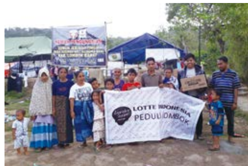
ロンボク島にチョコパイをお届け