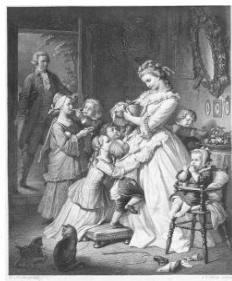
社名の由来である “若きウェルテルの悩み”のヒロイン 「シャルロット」