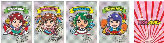
オリジナルクリアファイル (4種類)