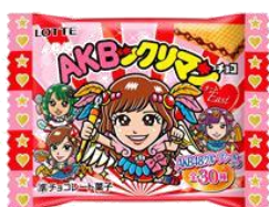
AKBツクリマンチョコ <チームEAST>30個入