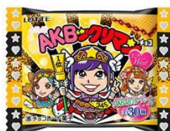
AKBツクリマンチョコ <チームWEST>30個入