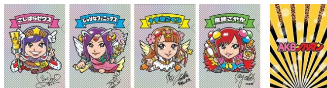
オリジナルクリアファイル (4種類)