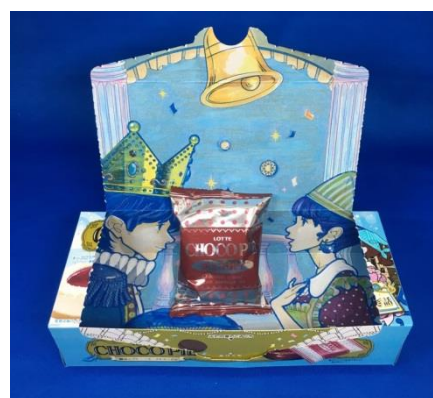
好きなものをのせて写真撮影