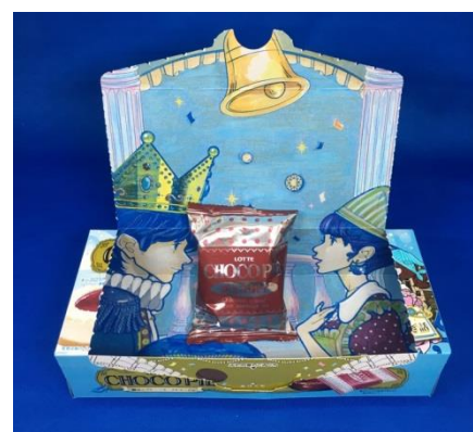
好きなものをのせて写真撮影