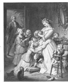
社名の由来である “若きウェルテルの悩み”のヒロイン 「シャルロット」