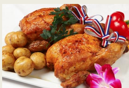
ローストチキン(ハーブ仕立て)