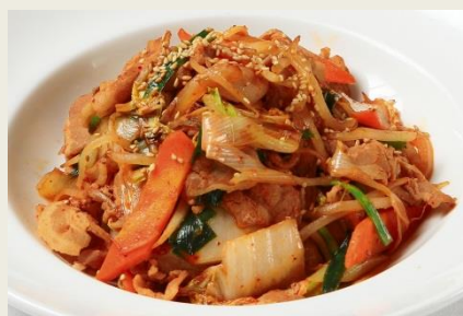
豚肉のピリ辛炒め