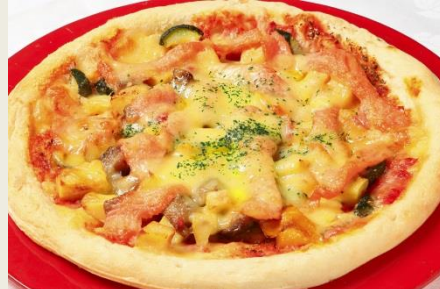
スモークサーモンのピザ