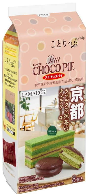
『ことりつぶ プチチョコパイ <ラマルクの抹茶のオペラケーキ>』

株式会社昭文社発行の「ことりつぶ」を持って、まるでおうちにいながらも旅したような気分を疑似体験できる新しいロッテの取り組みです。ぜひおうちにいながらも、旅したような気分をお楽しみください♪