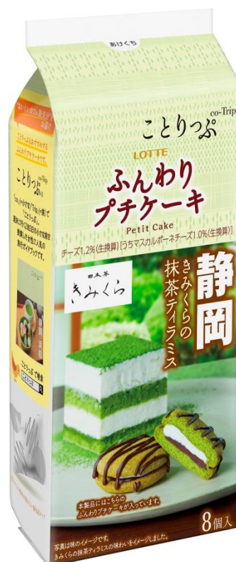
『ことりつぶ ふんわりプチケーキ <きみくらの抹茶ティラミス>』