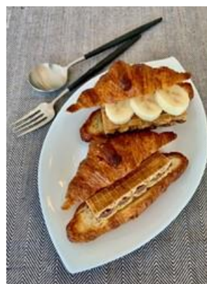
「“ビックリ”クロワッサン」