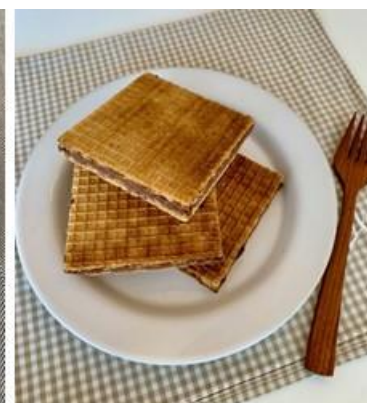
「焼きビックリマンチョコ」