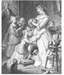
社名の由来である “若きウェルテルの悩み”のヒロイン 「シャルロッテ」