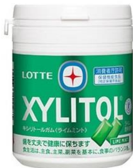
キシリトールガム<ライムミント>ファミリーボトル