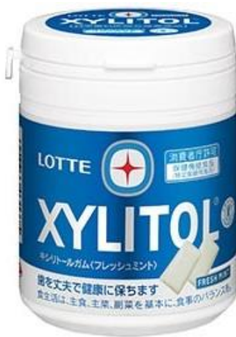
キシリトールガム<フレッシュミント> ファミリーボトル