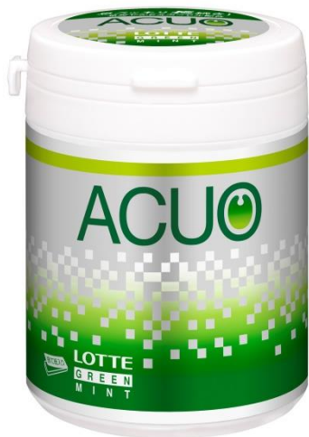
ACUO<グリーンミント> ファミリーボトル