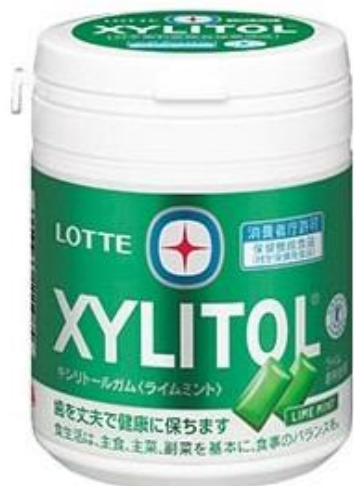
キシリトールガム<ライムミント> ファミリーボトル