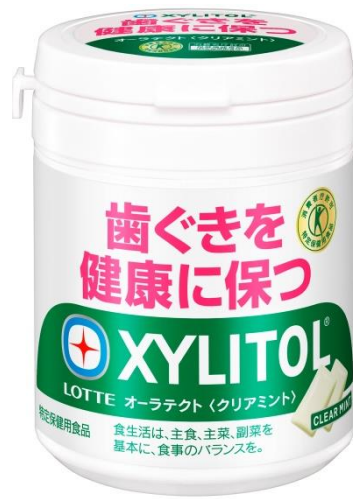
キシリトール オーラテクトガム <クリアミント>ファミリーボトル