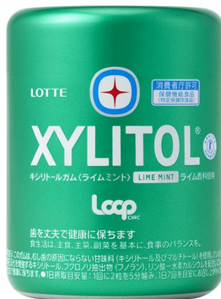
Loopキシリトールガム<ライムミント> 216G

株式会社ロッテ（代表取締役社長執行役員：牛腸 栄一）は、プラスチックごみによる社会課題解決に向け、「キシリトール」ブランドでプラスチック使用量削減に貢献する取り組みを開始しております。