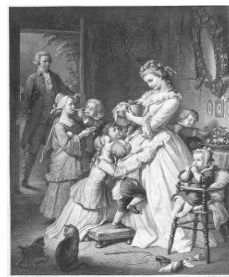
社名の由来である “若きウェルテルの悩み”のヒロイン 【シャルロット】

さらには、新型コロナウイルス感染症の影響により「幼稚園・保育園で歯磨きをすることができなくなった」「歯医者へ行く頻度が低くなった、行かなくなった」と回答した割合は、それぞれ約1割ずついることが明らかになりました。