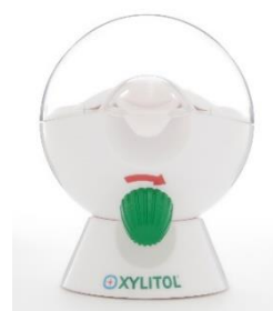
キシトールサーバー