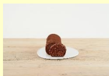
人気メニュー：低糖質ショコラロール

「低糖質ショコラロール」など、体もおいしい商品を手掛ける 人気のロールケーキ専門店