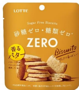
『ゼロ シュガーフリービスケット』