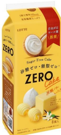
『ゼロ シュガーフリーケーキ <発酵バター×バニラ>』