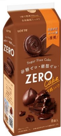
『ゼロ シュガーフリーケーキ <芳醇ショコラ>』

*食品表示基準に基づき、糖類0.5g未満 (100g当り)を糖類0(ゼロ)としています。 砂糖は食品表示基準における糖類に該 当します。