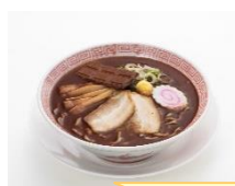
ブラック1杯 ご注文で！