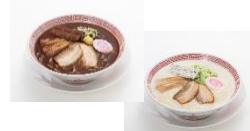
両方同時に ご注文で！