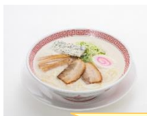
ホワイト1杯 ご注文で！