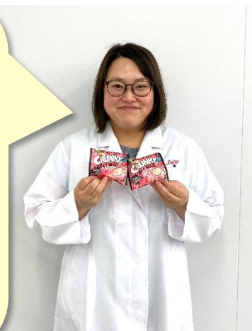
GET WILDクランキーポップジョイ<BIGベリー> 開発担当 金

<BIGベリー>を食べているこの瞬間、思いっきりチョコ菓子のおいしさを楽しみつつ、ストレスを発散した気分になってほしい！と考えて開発しました。ストロベリー味と食感のどちらも立たせるバランスが難しく、0.1g刻みで配合調整を幾度となく行いました。また初期段階では、ワイルドさを意識し過ぎて、ここではお見せできないようなビジュアルのチョコを次々と試作してしまい、周りから何度も制止、ダメ出しをされてしまいました。完成品のビジュアルは、一見ピンクのころころ形状がかわいらしいのに割ると中は黒とのコントラストが目立って、ワイルドな雰囲気を感じ取り出せたと思います。品質も、納得のワイルドなザクザク食感に仕上がりに、「早く皆さまに見て、食べて、楽しんでほしい！」と心から思いました。お菓子を食べる楽しさを提供したい思いを込めた商品ですので、日常生活から少し離れたと思った時！ワイルドな気分になりたい時！に、ぜひお召し上がりください！