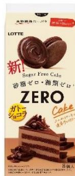
ゼロ シュガーフリーケーキ <ガトーショコラ>