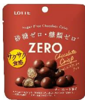
ゼロ シュガーフリーチョコレートクリスプ