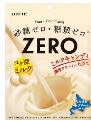
ゼロミルクキャンディ (袋)