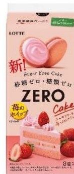
ゼロ シュガーフリーケーキ <苺のホイップ>