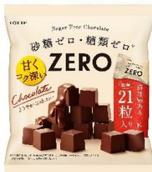
ゼロ チョコレート<袋>