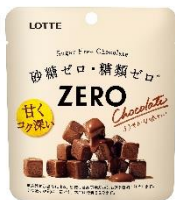
ゼロ シュガーフリーチョコレート ※コンビニエンスストア・駅売店限定