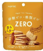
ゼロ シュガーフリービスケット