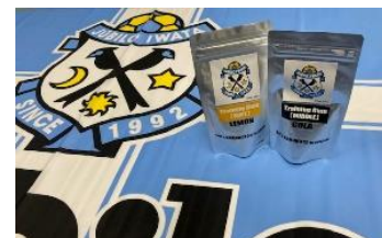
ジュビロ磐田専用トレーニングガム

練習中や食後、試合前にガムを噛んでおり、今後も公式戦や練習中のリラックス効果、唾液分泌、集中力アップに期待しトレーニングガムを噛みたいです。多くの勝利を届けることができるよう今シーズンも頑張ります！応援よろしくお願いします。