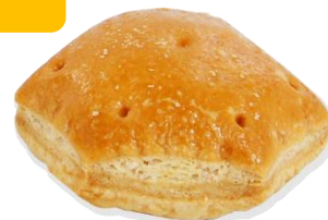
『おおきなパイの実』