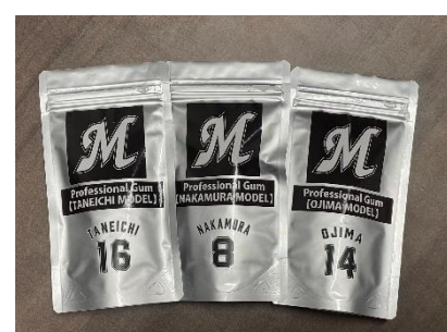
チームロゴ・選手名・背番号がデザインされた選手専用プロフェッショナルガム