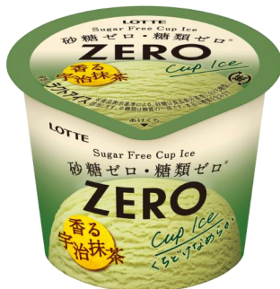
ZEROミニカップ＜宇治抹茶＞