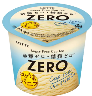
ZEROミニカップ＜バニラ＞

*食品表示基準に基づき、0.5g未満（100g当り）を糖類0（ゼロ）としています。砂糖は食品表示基準における糖類に該当します。※糖類は糖質の一部です。本品は糖質を含みます。