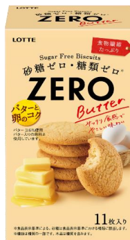
ゼロ シュガーフリービスケット ＜バター＞