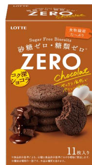
ゼロ シュガーフリービスケット ＜ショコラ＞