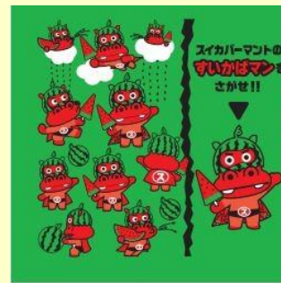
レッテルデザインの一例