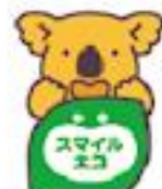
スマイルコアラベルコアラ