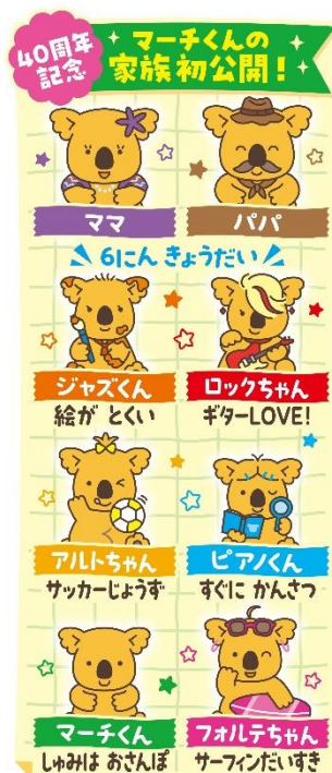
※パッケージのイメージ図