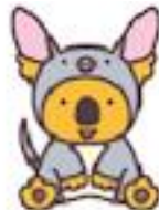
ミナガハチディクトコアラ