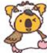
ワライカワセミコアラ