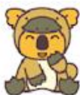
カモノハシコアラ