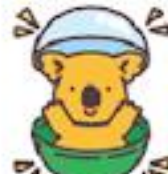
カプセルトイコアラ