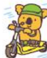
キックスクーターコアラ