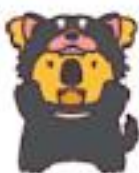
タスマニアデビルコアラ