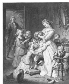
社名の由来である “若きウェルテルの悩み”のヒロイン 【シャルロッテ】