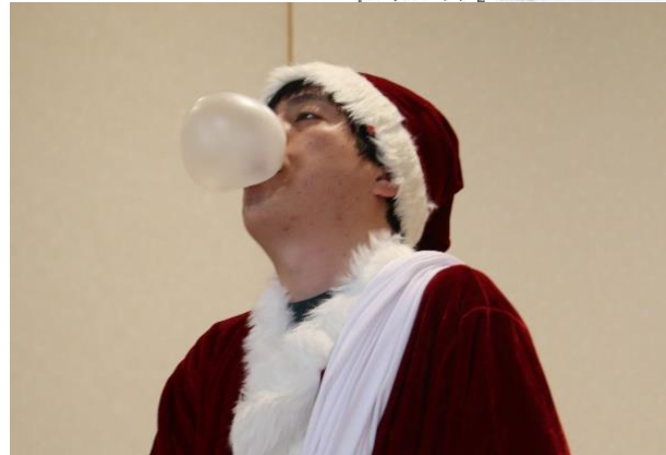
大きなフーセンガムを披露するフーセンガム名人