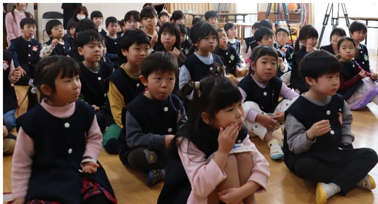
ガムを噛んでいる園児