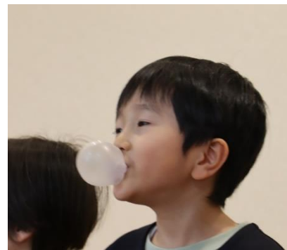
フーセンガムをふくらませる園児