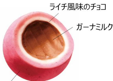
ローズ香るフランボワーズチョコ

ライチ風味のチョコ ガーナミルク ローズ香るフランボワーズチョコ、華やかなライチ風味のチョコ、とろけるくちどけの濃厚なガーナミルク、こだわりの3層仕立てにより、ガーナミルクと「イスパハン」の調和をお楽しみいただける魅惑的なトリュフです。今日一日を頑張ったご褒美に、贅沢なひとときを