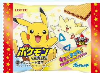
ポケモンウエハースチョコ