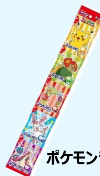
ポケモンラムネ5パック