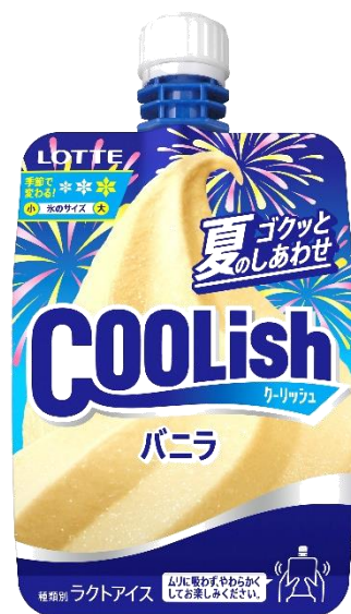
夏季限定<夏のゴクツとしあわせ>