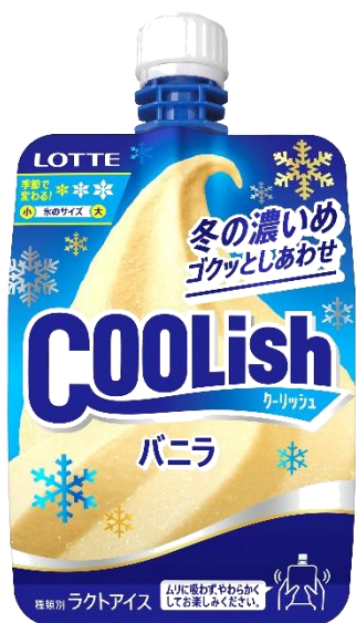
冬季限定<冬の濃いめ> ※2023年発売商品