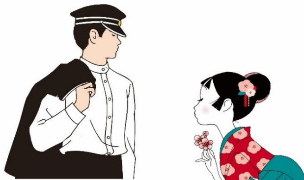
真さんと小梅ちゃん

時代が変わっても「恋する気持ち」は親子、世代を超えて共感できる、変わらないもの。今ではキャンディにとどまらない商品展開で、小梅ちゃんの「恋する想い」をそっと胸に秘めている姿に「小梅」のあまずっぱさを通して、お客様の共感を呼び、長く愛されるブランドになっています。