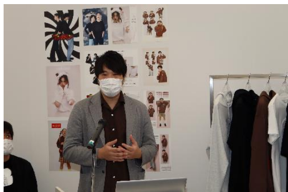
コラボ趣旨を説明するロッテ本原