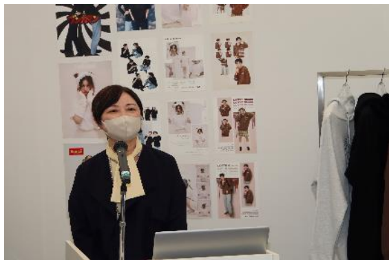
冒頭あいさつする相原学院長