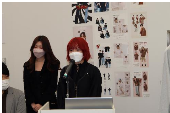
アパレルの説明をする学生