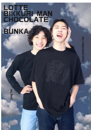
BIKKURI MAN Bii Tee